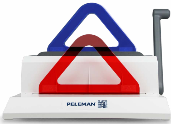
Thermal Binding Machine 120